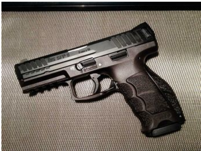
Marcel Fosca, CC-BY-SA 3.0, Wikimedia Commons

Bei der sächsischen Polizei sind offenbar mehrere Tonnen Munition verschwunden . Das räumt Innenminister Armin Schuster auf unsere Anfrage hin ein. Die Rede ist von einem „Fehlbestand“ von 188.691 Patronen, zugleich seien „eine größere Anzahl von Waffen“ und „einige Schlagstöcke“ nicht auffindbar. Bekannt sei das dem Innenministerium seit September 2024. Doch erst Ende März 2025 soll abschließend geprüft sein, welche Waffen und Munition die Polizei