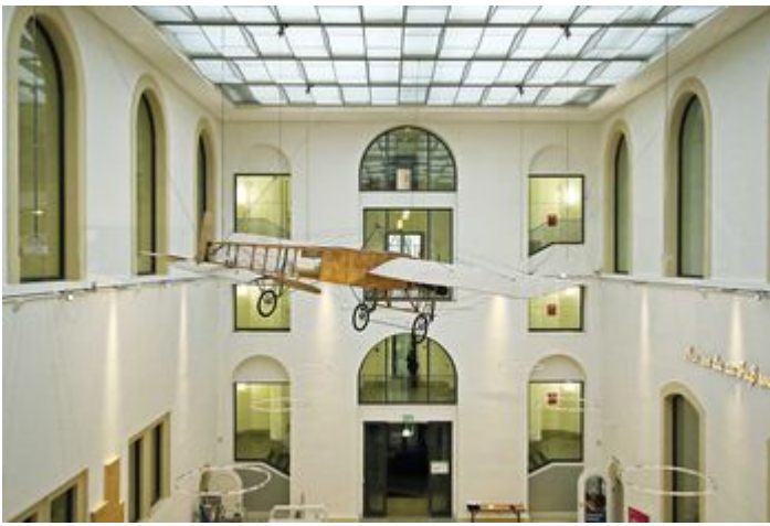
Kora27, CC BY-SA 4.0, via Wikimedia Commons