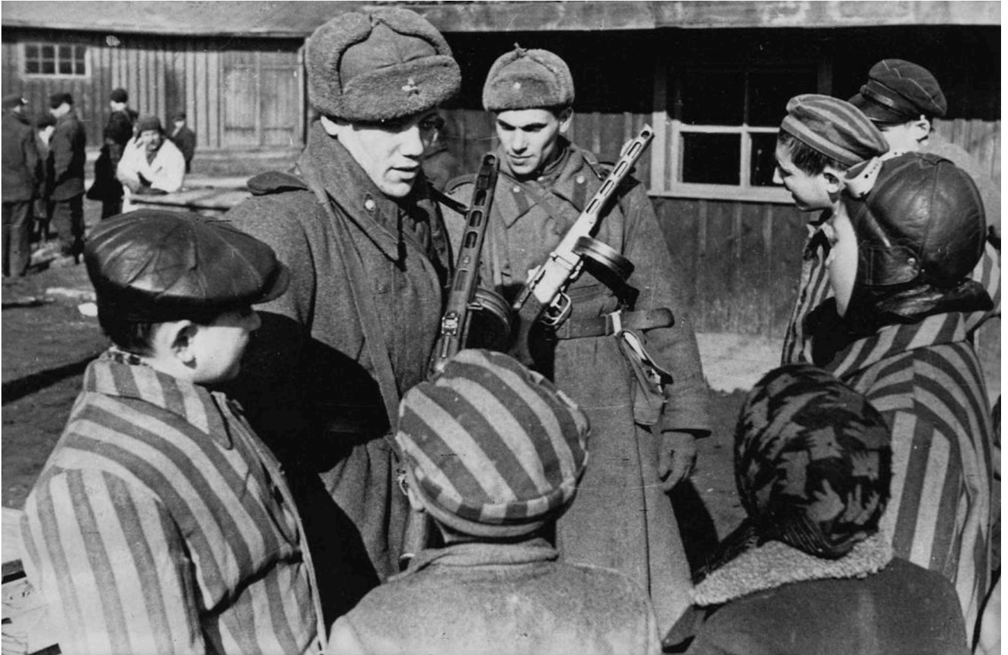
Vor 77 Jahren befreite die Rote Armee das Vernichtungslager Auschwitz. Kein Vergessen! Nie wieder Faschismus!

DIE LINKE. Fraktion im Sächsischen Landtag