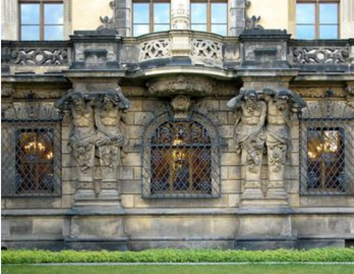
Jörg Blobelt, CC BY-SA 4.0, via Wikimedia Commons

Unser Fraktionschef Rico Gebhardt hatte sich angesichts einer SPIEGEL-Recherche zu Vorbereitungshandlungen der Täter nach neuen Erkenntnissen zum Juwelenraub aus dem Grünen Gewölbe in Dresden erkundigt . Die Staatsregierung hat bestätigt, dass die Täter das historische Fenstergitter bereits Tage vor der Tat durchtrennt und danach wieder zusammengeklebt haben. Und: Die Außenhautsicherung versagte, weil das Einstiegsfenster im toten Winkel lag und der entsprechende